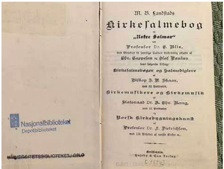
Tittelbladet i «N.B. Landstads Kirkesalmebok og «Nokre Salmar», første utgåva, desember 1893