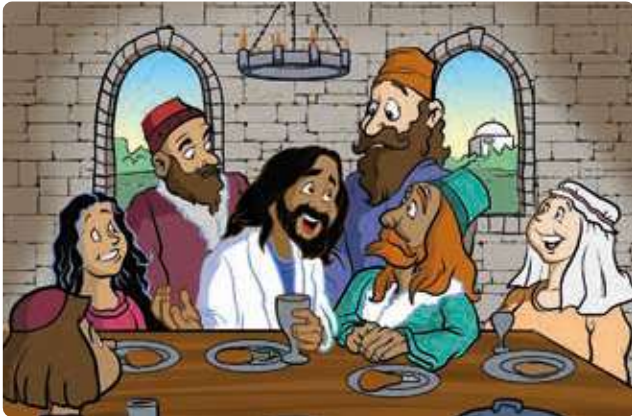
Teikning: Trevor Keen

Desse to bilde er nesten heilt like. Klarar du å finne 5 feil på det eine bildet?