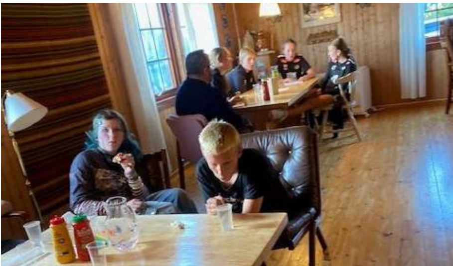
Pølser på Kyrkjelydshytta