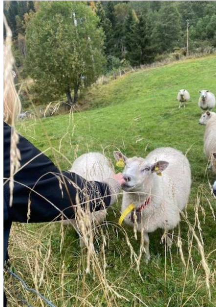
Sauer er også ein del av skaparverket