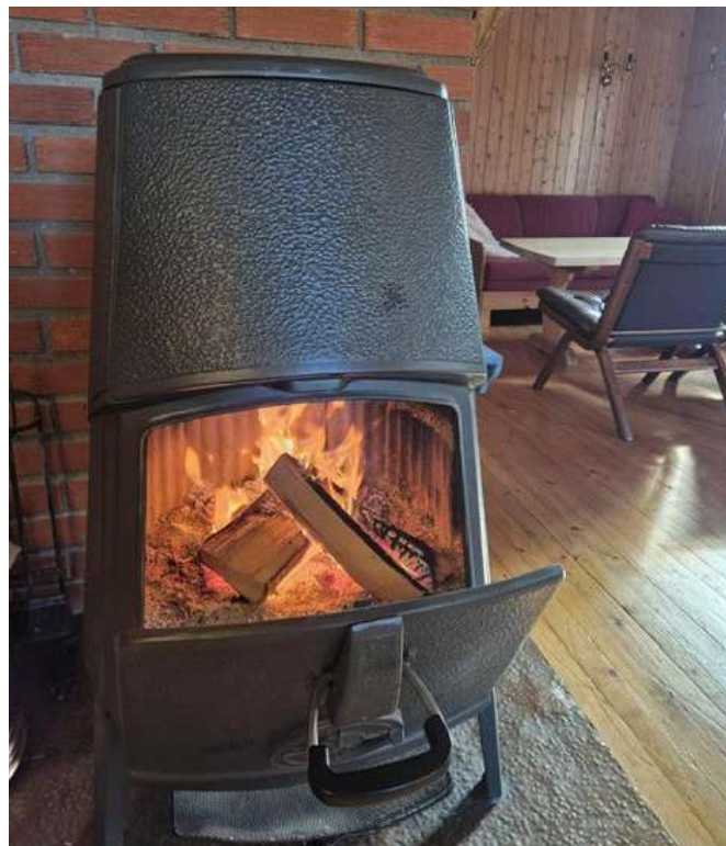
Fyr i ovnen