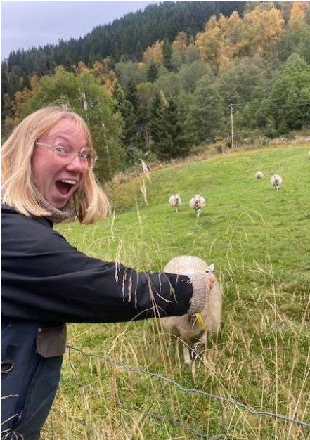
Ivrig danske møter sau