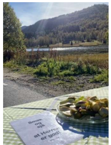
Smak og sjå at Herren er god